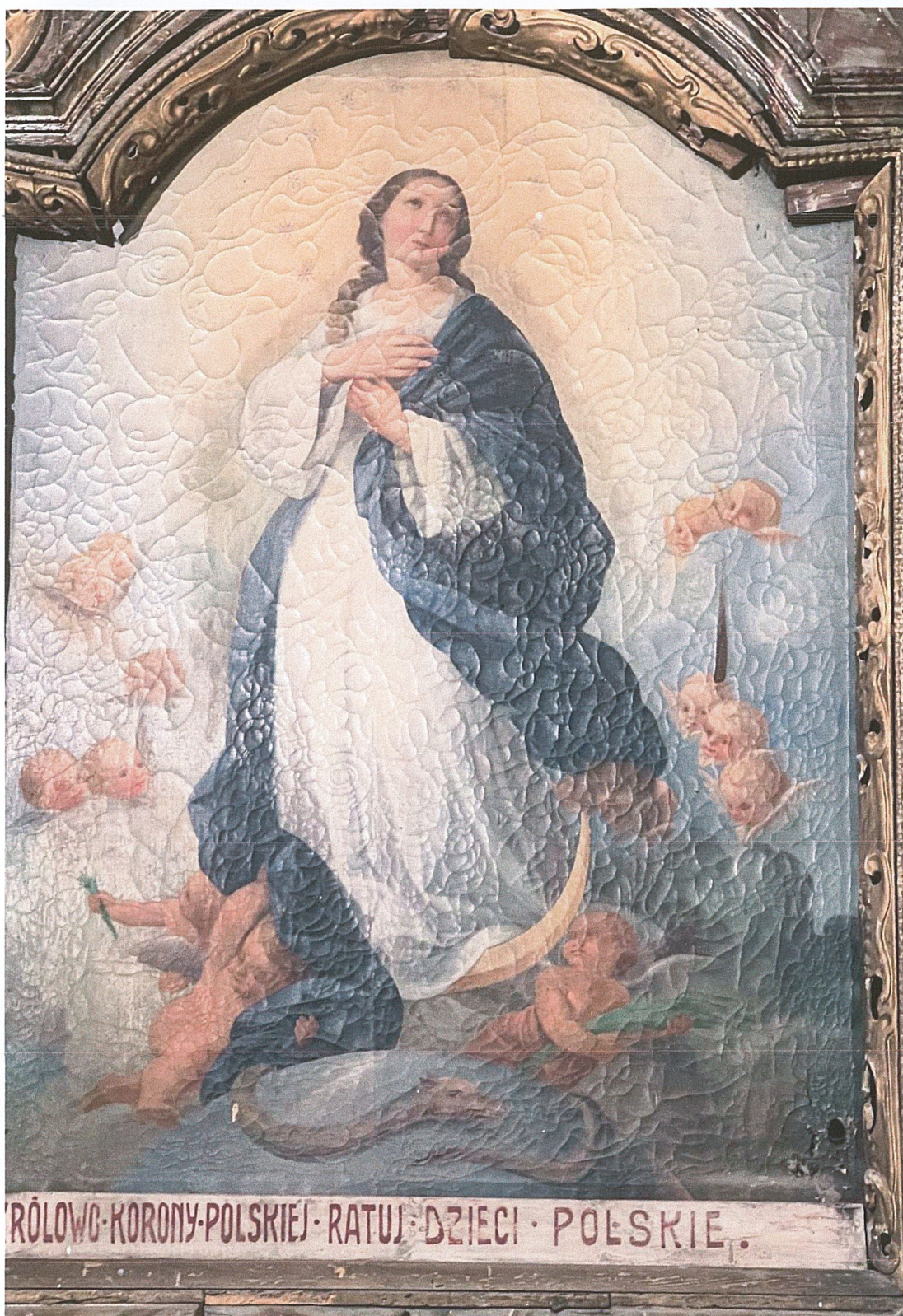
Fot. 7. Stan przed rozpoczęciem prac