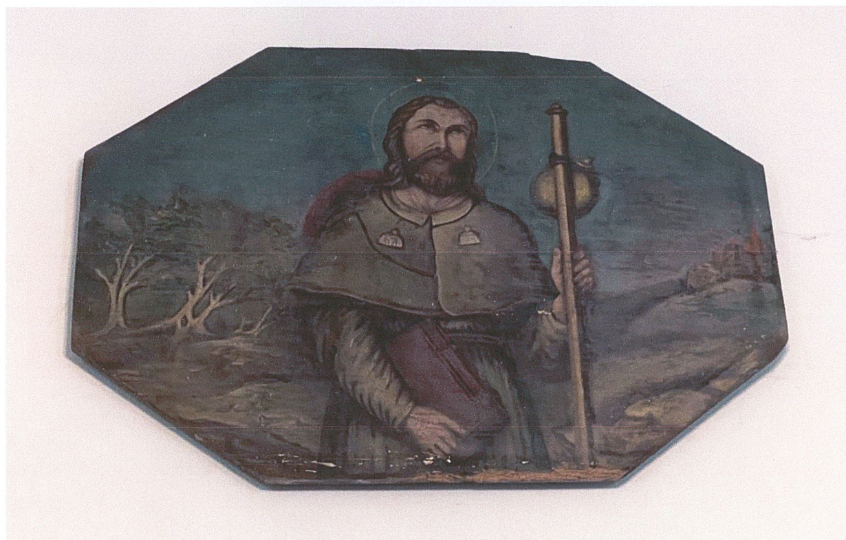
Fot. 6. Stan przed rozpoczęciem prac