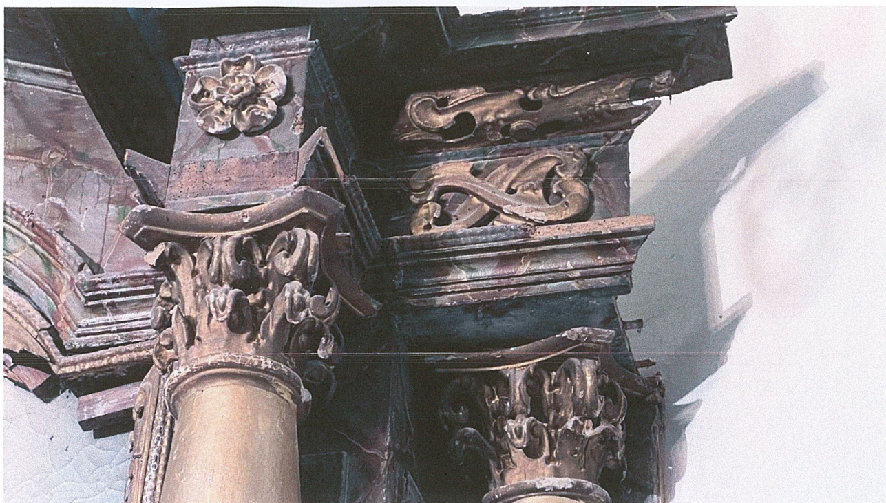
Fot. 5. Stan przed rozpoczęciem prac