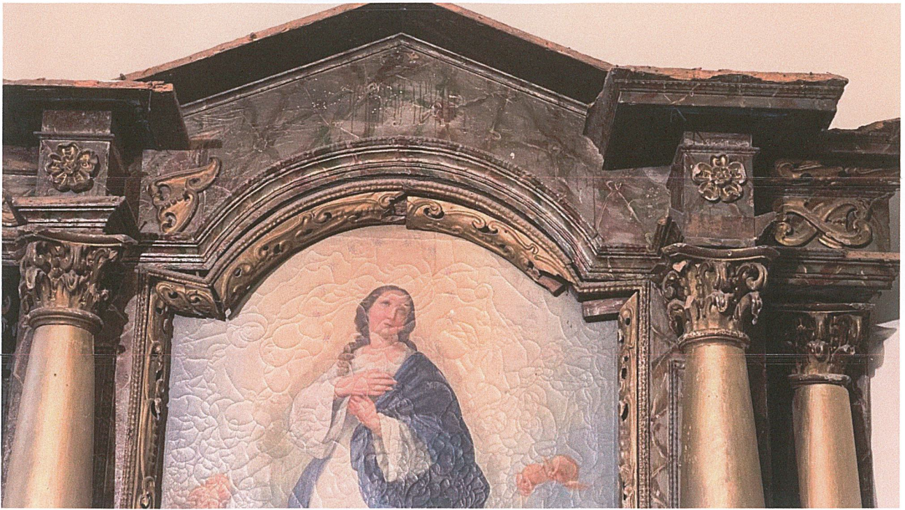
Fot. 8. Stan przed rozpoczęciem prac