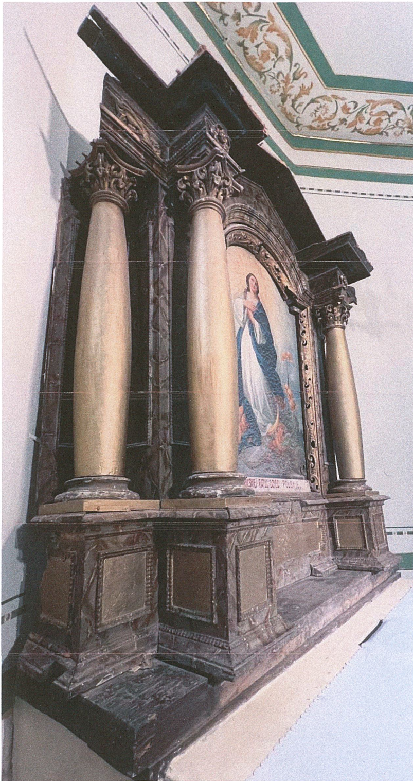
Fot. 10. Stan przed rozpoczęciem prac