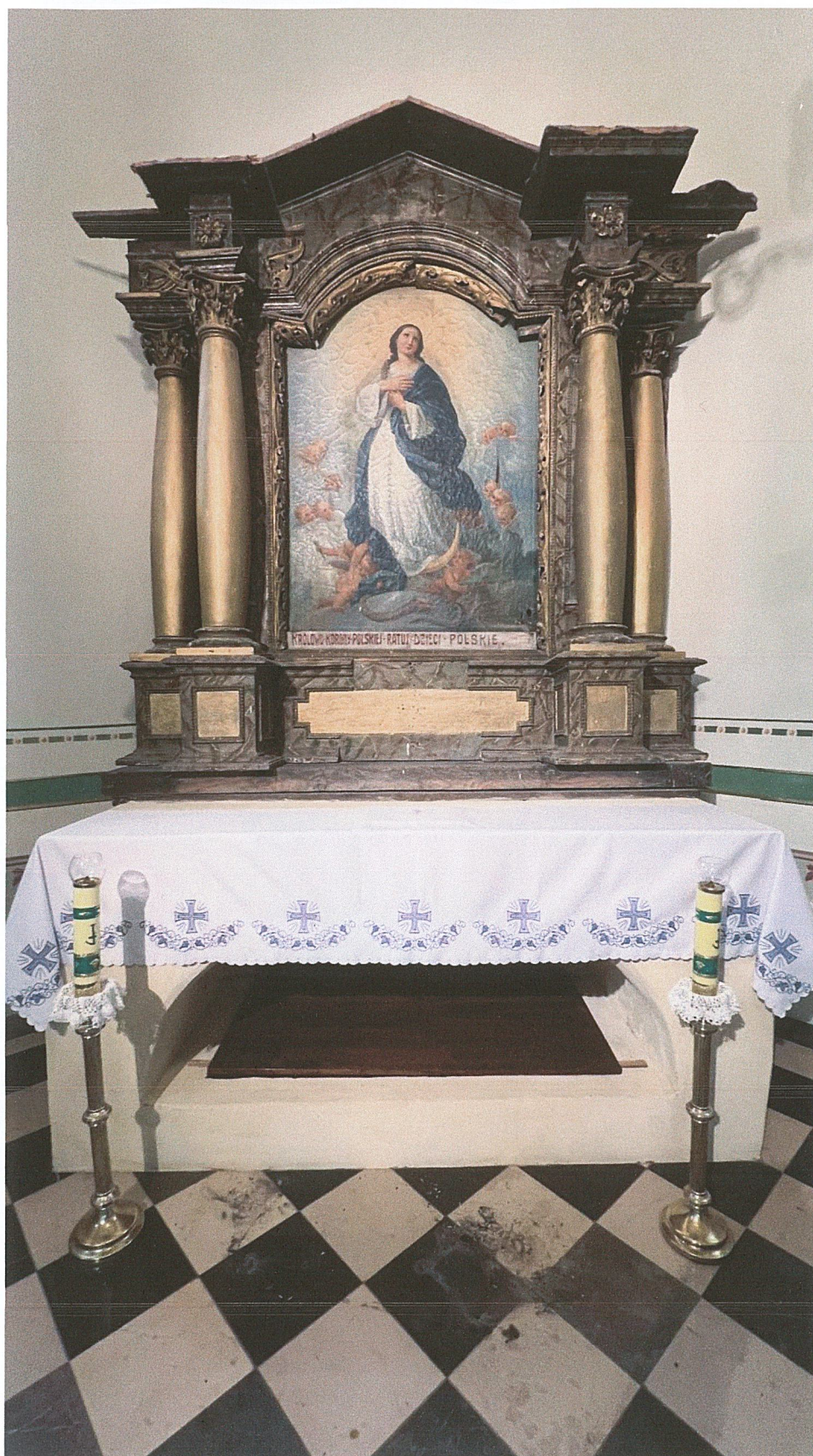
Fot. 2. Stan przed rozpoczęciem prac