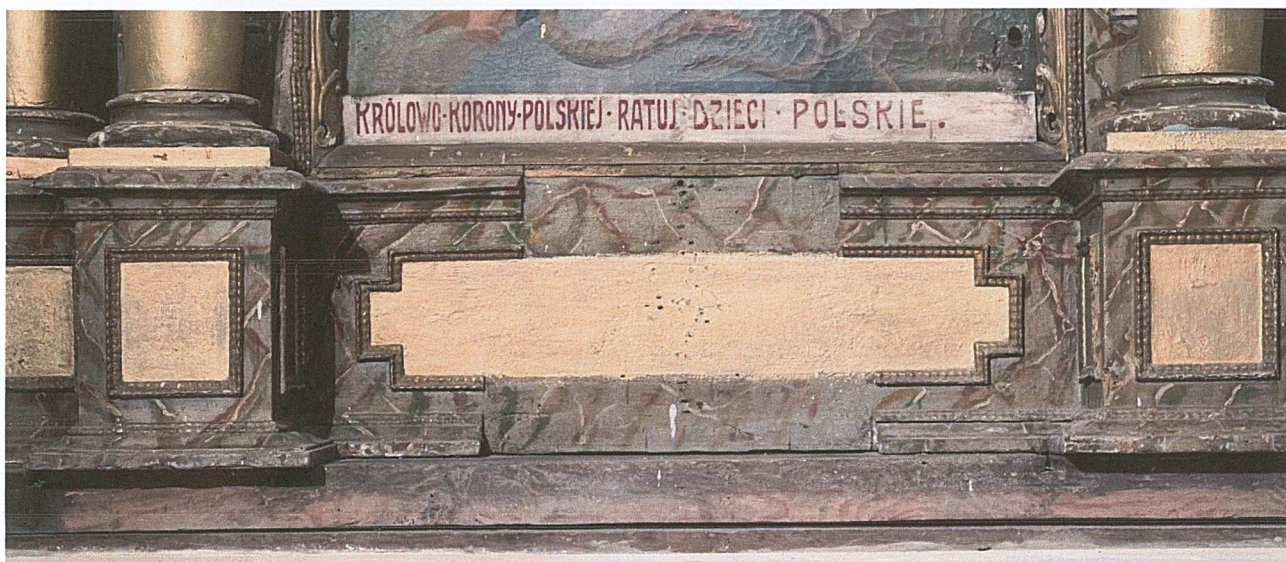
Fot. 3. Stan przed rozpoczęciem prac