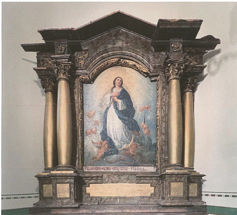
Fot. 9. Stan przed rozpoczęciem prac