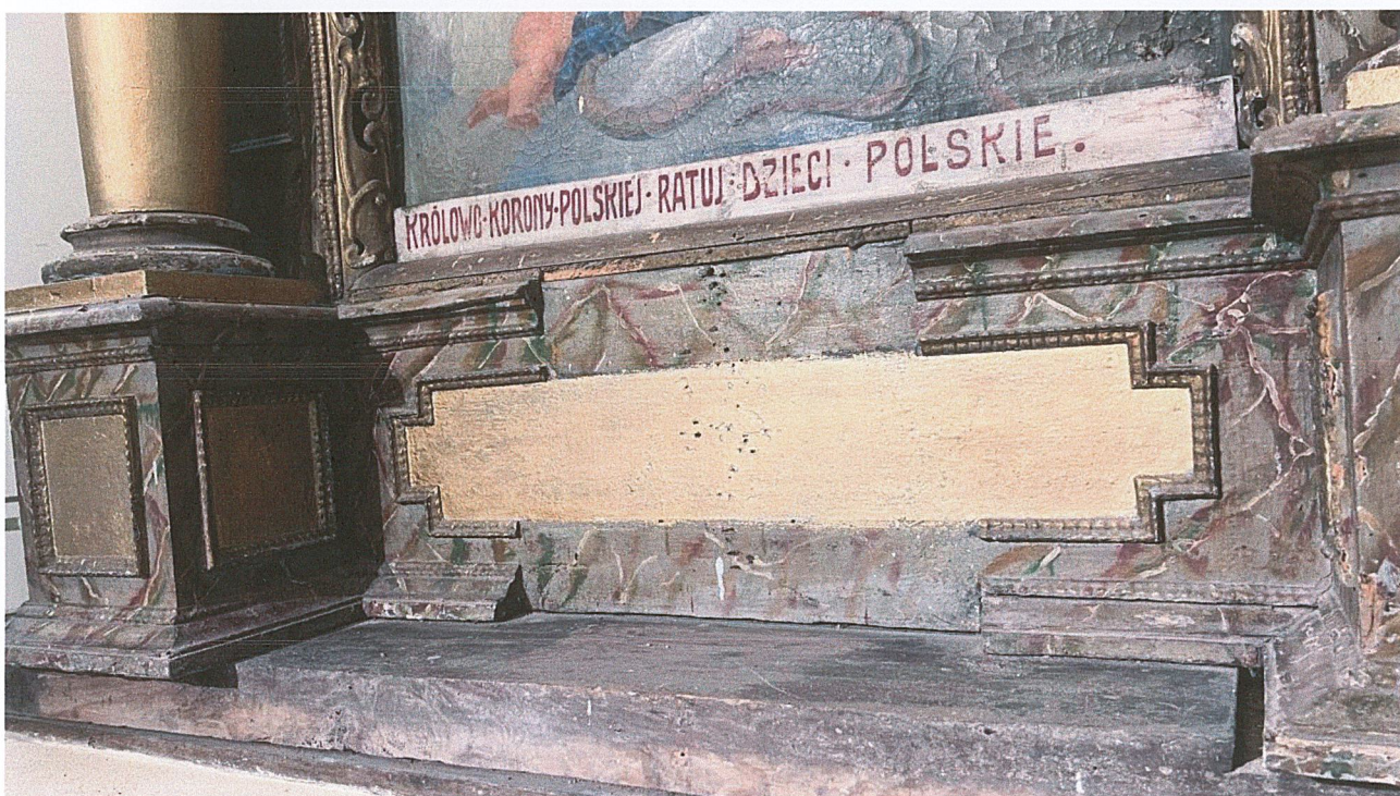
Fot. 4. Stan przed rozpoczęciem prac