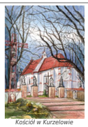
Kościół w Kurzelowie

Badania archeologiczne prowadzone na terenie powiatu dowodzą bardzo odległych początków osadnictwa ludzkiego na tym obszarze. Najstarsze ślady w okolicach Kozłowa datowane są na wczesny mezolit. Szczególnie intensywne było ono w dobie tzw. kultury lużyckiej, czego dowodem są licznie odkrywane ślady osad i cmentarzyk ciałopalnych. Najstarsze zachowane zabytki budownictwa mają jednak rodowód dopiero średniowieczny. W pierwszej kolejności należy wymienić pozostałości grodziska we Włoszczowie . Ma ono formę znacznych rozmiarów kopca ziemnego, użytkowanego wśród łąk, na południe od miasta. Dawniej były tu mokradła i na nich (prawdopodobnie w XIII wieku) zbudowano grodzisko z wieżą mieszkalno-obronną na wierzchołku. Obecnie znajduje się na nim późnobarokowa kamienna figura św. Jana Nepomucena z 2 poł. XVIII w. Podobny charakter, choć nieco mniejsze rozmiary posiada gródek w Bebelnie . Reprezentuje on typ tzw. grodzisk ostrosłupowych. W wyniku prowadzonych tu badań stwierdzono dwa okresy osadnictwa przypadające na XIII i XV-XVI wiek.