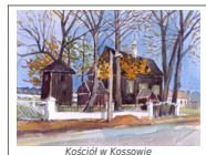
Kościół w Koszowie

Cennymi zabytkami architektury sakralnej są nieliczne zachowane budowle drewniane: kaplica cmentarna św. Anny w Kurzelowie z 1 poł. XVII w. oraz kościół parafialny p.w. Wszystkich Świętych w Koszowie z początku XVII w. i p.w. św. Michała Archanioła w Bebelnie z 1745 r. Tym ostatnim towarzyszą również współczesne im drewniane dzwonnice. Na ich tle wyróżnia się mająca obronny charakter drewniana dzwonnica przy kościele parafialnym w Kurzelowie z XVII-XVIII w.